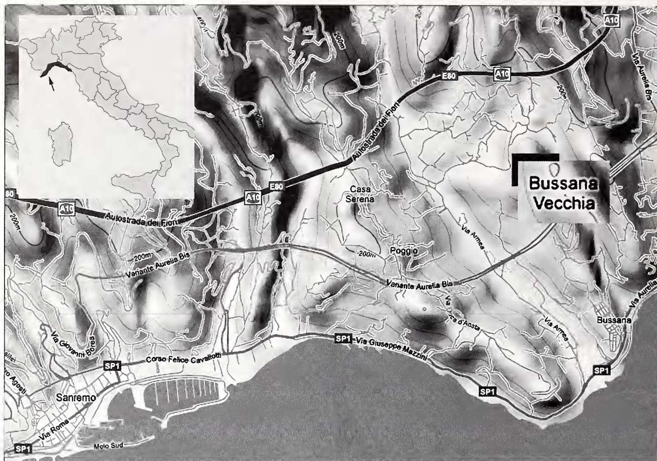
Fig. 1. Ubicazione di Bussana Vecchia (Imperia).